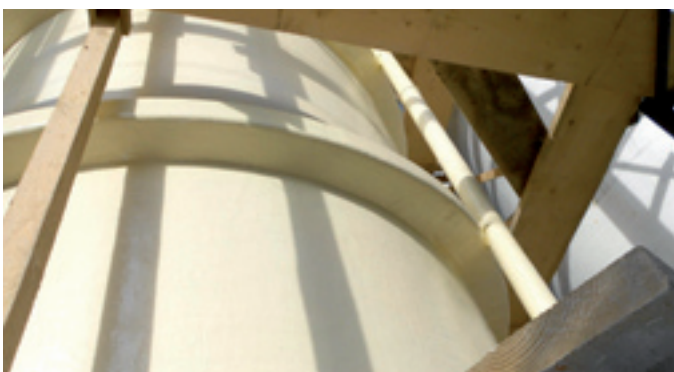
Finish durch Polyurethan-Deckbeschichtung Proguard 169

Da bei dem Füllvorgang und der Entnahme aus dem Tank unter Umständen Flüssigkeit entweichen kann, wurde vom Kunden auch eine hochresistente Außenbeschichtung gewünscht.