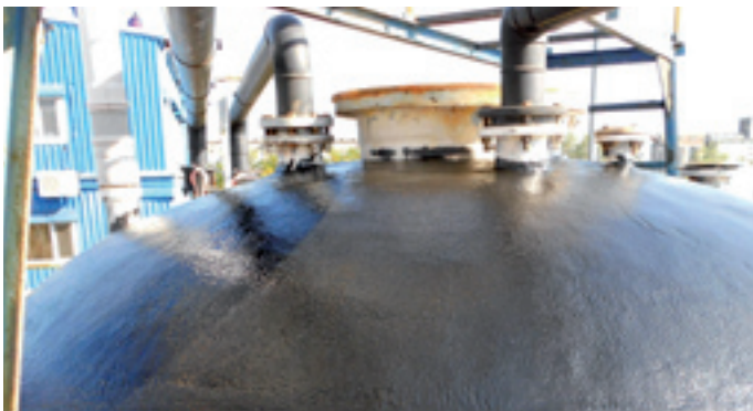
Applikation des Schutzsystems ULTRA PERFORM 2R

» Rumänien, Oktober 2014: Bei einem namhaften Hersteller von anorganischen Koagulationsmitteln wurde ein GFK-Lagertank für Salzsäure mit unserer neuartigen, säurefesten Beschichtung ULTRA PERFORM 2R sowie dem hochwertigen Polyurethan-System für Außenanwendungen Proguard 169 wirkungsvoll saniert.