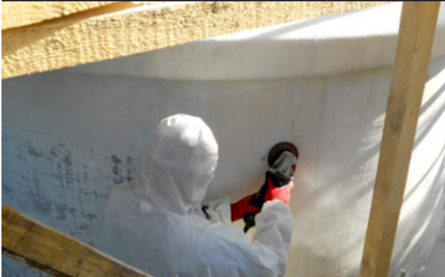
Eine akkurate Vorbehandlung des Untergrundes ermöglicht die optimale Haftung der Beschichtung